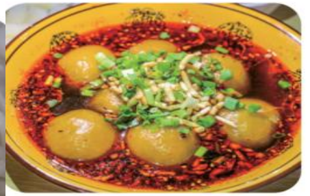
遵义-乌江寨-结束行程